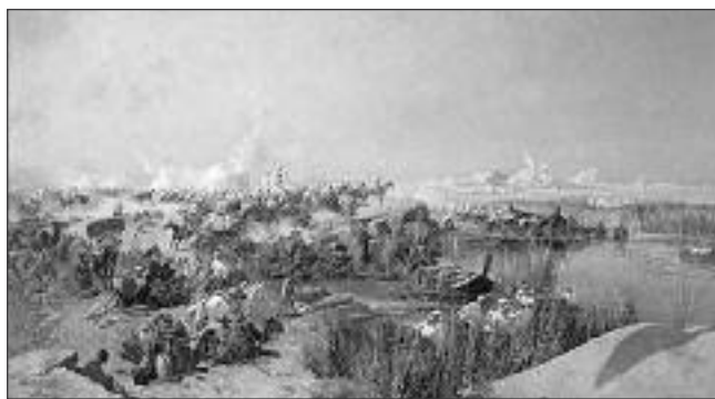
Первое появление русских войск на Амударье. Переправа Туркестанского отряда у Шейх-арыка. Художник Н.Н. Каразин

мечает и историк Б. Чижов. 234 Ханские войска пытались помешать движению русских войск: внезапные нападения на лагерь, перестрелки, угрожающие атаки и столь же внезапные отступления наездников, боевые