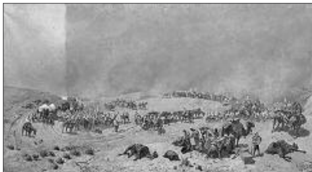
Хивинский поход 1873 г. Через пески к колодцам Адам-Крылган. Художник Н.Н. Карзин. 1888. Гос. Русский музей.

лял собой мрачную картину: истомленные тяжелым переходом, мучимые жаждой, с запекшимися губами люди, измученные, исхудалые, с мутными глазами лошади, верблюды, эти умные животные, смотревшие по сторонам и как бы взы-