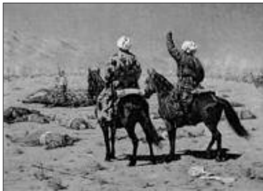
Парламентеры. Картина художника В.В. Верещагина

вверх, выливали воду из сапог, строились в цепи и сразу шли в штыковую атаку. (Бухарцы восприняли эти действия как некий магический обряд, приносящий победу, и даже пытались позднее повторять его на сухих местах перед предстоящим боем.) Бухарское войско в панике бежало, оставив лагерь и 21 пушку. Жители Самарканда закрыли ворота и не пустили разбитую армию эмира в город. Убегающих не преследовали.