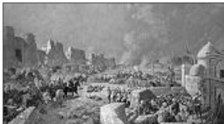
Вступление русских войск в Самарканд. Художник Н.Н. Каразин

был отдан приказ: «Войска, собранные для действия в бухарских владениях! Внезапно поднялись Вы со своих квартир и быстро собрались на Ключевом и в Яны-Кургане. Вы были веселы, у Вас был порядок, я любовался Вами. От Яны-Кургана в два дня прошли Вы почти 70 верст. На Самаркандских высотах неприятель хотел запереть Вам дорогу. Сильна была его позиция, но Вас она не остановила. Под перекрестным огнем неприятеля прошли Вы болота и молодецки бросились на высоты. Неприятель бежал, оставив в руках Ваших 21 орудие. Окружив Вас со всех сторон, неприятель пытался нанести Вам вред в обозе, но и тут встретил дружный отпор. Спасибо Вам от мала до велика: Вы вели себя так, как я ожидал, свято и честно исполнили Вы свой долг и присягу Государю Императору. С такими войсками, как Вы, везде победа и торжество. Ура, Вам, молодецкие войска!» 149