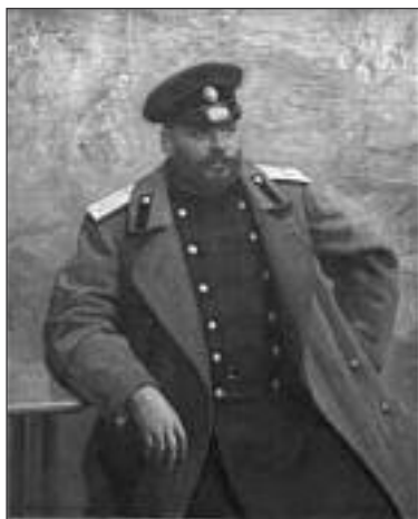
Портрет генерала А.К. Гейнса художника И.Е. Репина (1896)

Осмотрев границы и приняв ряд мер для налаживания мирных отношений с правителями соседних государств, К.П. фон Кауфман приступил к организации структуры управления вверенного ему края. «Едва ли какому либо генерал-губернатору когда-нибудь приходилось принимать край более расстроеным. Масса злоупотреблений, общее недоверие и злоба местных жителей на русскую администрацию — вот тогдашнее положение дел в Туркестане», — отмечал А.А. Семенов. 129 Первостепенной стояла задача устройства гражданского управления, создания особой системы военно-народного