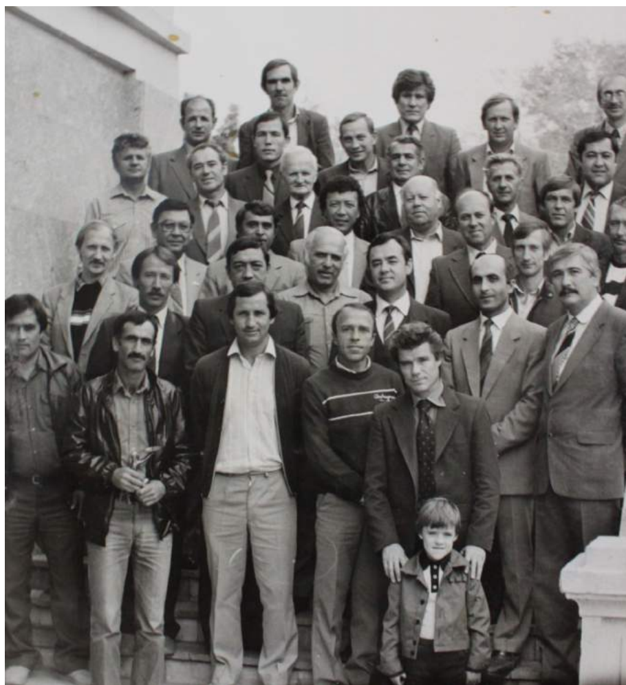
Встреча Г.Д. Качалина с футбольным активом г. Ташкента. 1986г.