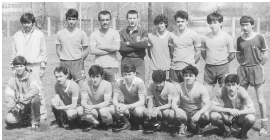
Команда болельщиков "Пахтакорчи" ("Пахтакоровец") - бронзовый призер чемпионата Ташкента-93 среди взрослых команд