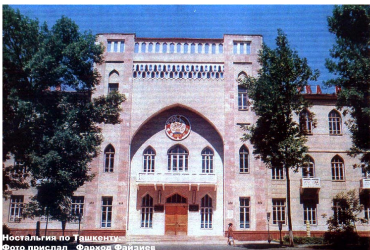
Ностальгия по Ташкенту.

Между Топографической и Куйбышевской располагалась совсем уж маленькая - машина с трудом проедет - улочка, которая собственно и называлась не улица, а переулок – Топографический переулок. В самом начале переулочка находился детский сад для детей работников ЦК Компартии Узбекистана, сам ЦК тоже располагался неподалёку, на Гоголя, где теперь библиотека Академии наук. Выглядел он так.