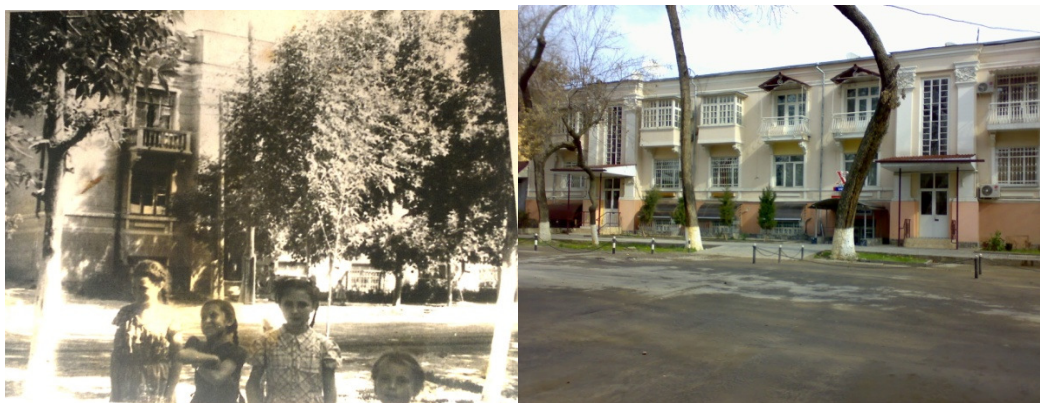
Девочки моей улицы(на заднем планеА такой он сейчас, тот самый дом с балконами).