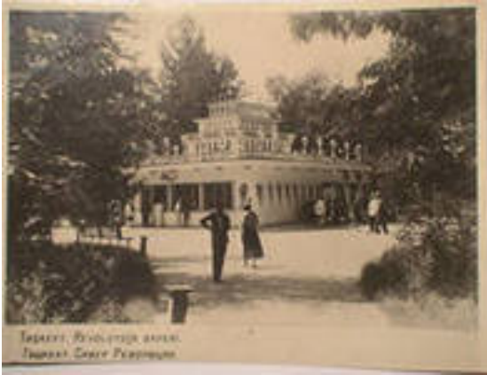
Кафе "Лотос" (старое фото)