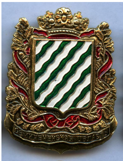
В проектном виде

В виде знаков этот герб выглядит следующим образом: