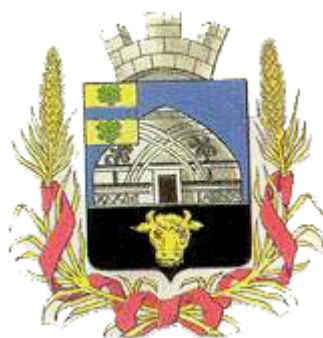
Перовск (Кызыл Орда)