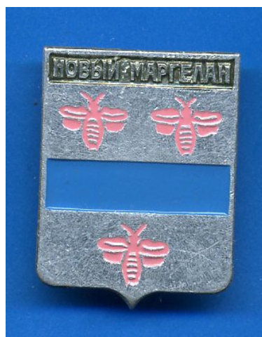
Новый Маргелан (Фергана)

Сувенирный набор знаков выглядит следующим образом.