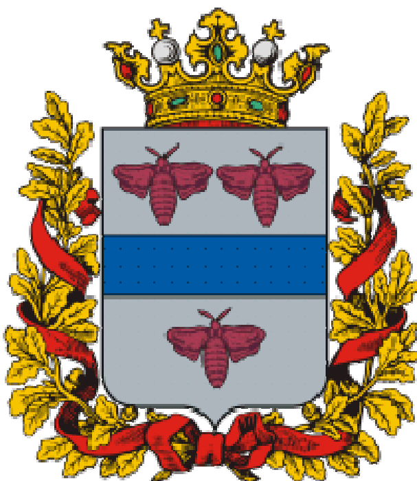
Герб Ферганской области

Ферганская область — административная единица Российской империи. Административный центр — г. Коканд. Занимала юго-восточную часть русских владений в Средней Азии (Туркестанского генерал-губернаторства) и лежит вместе со входящим в состав её Памиром между 37° и 42° с. ш. и 70° и 74°30' в. д. На севере и северо-западе граничила с Сырдарьинской областью, на северо-востоке — с Семиреченской областью, на востоке — с Китайской империей (Кашгар), на юге — с землями, расположенными в верховьях Пянджа и находящимися в сфере афганско-английского влияния, на западе — с бухарскими владениями (Вахан, Шугнан, Рошан, Дарваз и Каратегин) и с Самаркандской областью. Площадь её — около 141141 кв. вёрст (160141 кв. км), с 1560411 жителями. Делилась на 5 уездов (Маргеланский, Андижанский, Кокандский, Наманганский, Ошский) и Памир. В гербе три шелковичные бабочки